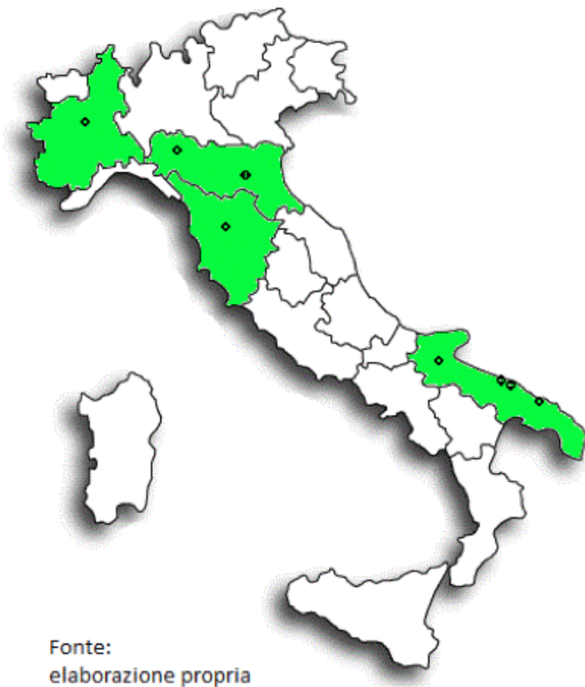
Figura 3 Regioni sede di Scuole di Agopuntura Accreditate